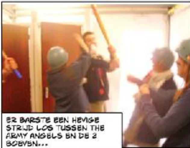
ER BARSTE EEN HEVIGE STRIJD LOS TUSSEN THE ARMY ANGELS EN DE 2 BOEVEN...