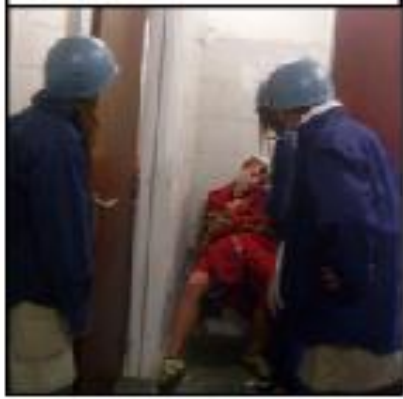
ZE OVERWONNEN HET GEVECHT EN BEVRIJDDEN DE KERSTMAN